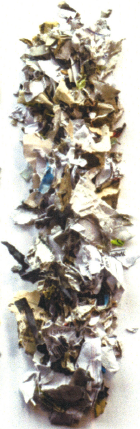
P-2 Sieblochung 40 mm