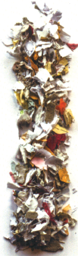
P-3 Sieblochung 30/35 mm