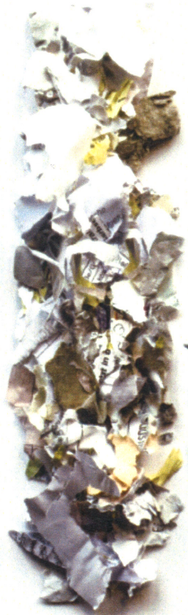
P-1 Sieblochung 50 mm