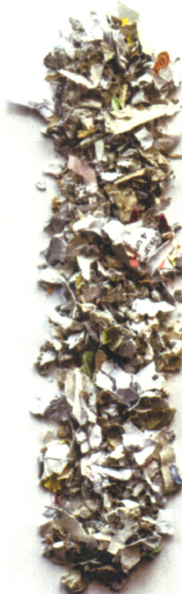
P-4 Sieblochung 20 mm